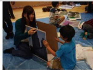
④絵を描いたボードを三角形に 組み上げ、動物ボードを 作ります。