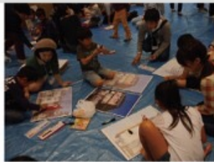
③まちあるきを終わったらボード に貼りつけた建物の写真の上 に見えた動物の絵を描きます