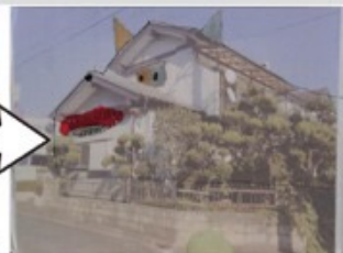
子どもの発想で動物に大変身！