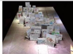
⑤動物ボードをまちの 地図の上に置いていくと サファリタウンの完成！！