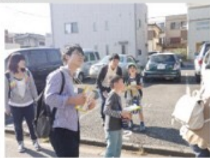
②まちあるきスタート！ 動物に見立てられる建物を 探して写真を撮ります