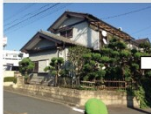
普通の何気ない建物が・・・