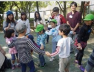
①まずはアイスブレイク！ 大人と子ども一緒になって みんなで人間知恵の輪！